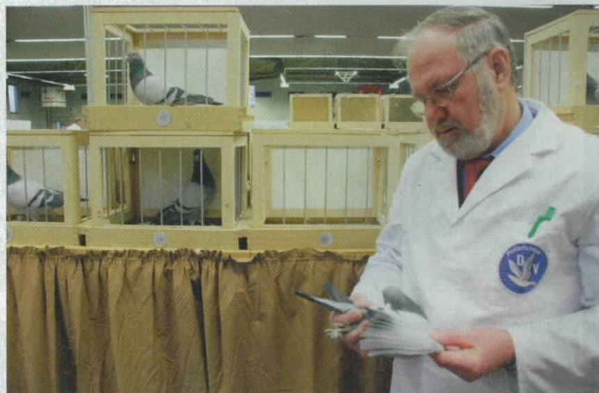
Man meint, man hätte eine außergewöhnlich schöne Taube. Bis einen der Preisrichter eines Besseren belehrt. Es gibt schönere. Und er hat auch die Begründung dafür.

Der Wind und seine Richtung lassen sich von Dir nicht beeinflussen. Völlig unnötig, Dich damit zu befassen. Und wenn Dir die Lage nicht passt, zieh um! Wenn Du das aus finanziellen Gründen nicht kannst oder willst, dann vergiss es ein für allemal! Diese Diskussionen bringen Dich nicht weiter auf Deinem Weg zum Erfolg, im Gegenteil, sie halten Dich nur an falscher Stelle auf.