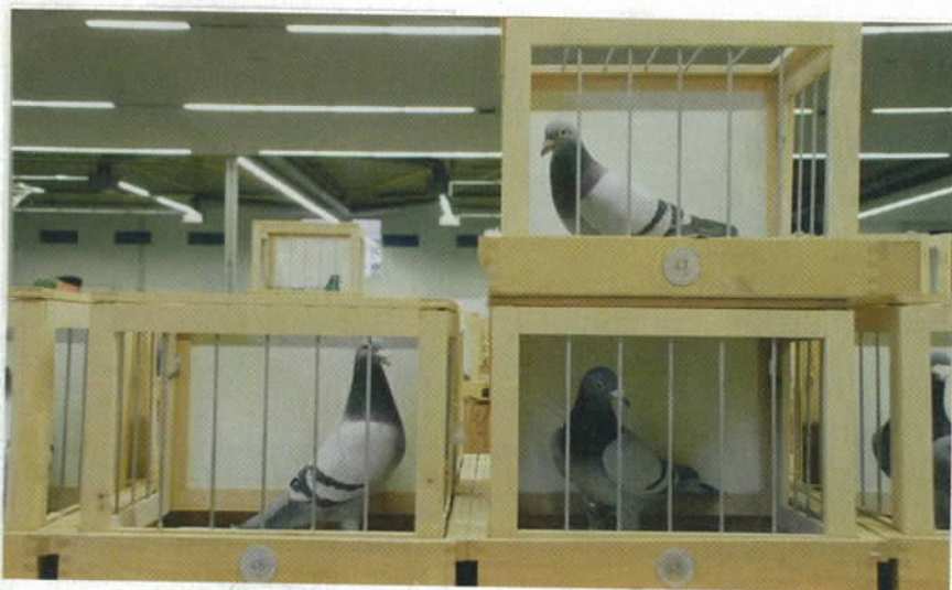
Auf der DBA hat man als Züchter den unmittelbaren Vergleich, wenn die Cracks direkt nebeneinander stehen.

Auch Du wirst Züchter kennen, die seit Jahrzehnten jedes Jahr dasselbe Lied klagen, zum Beispiel „ich habe zu viele“. Warum? Außer Du als Chef kann doch kein anderer etwas daran ändern! Konsequenz (tu das, wovon Du redest) heißt das Zauberwort, das uns auf Deinem Weg zu mehr Erfolg und Zufriedenheit konsequent begleiten wird.