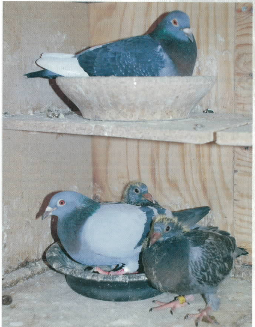
Mit der Zucht fängt alles an: Freud und Leid! Sei Dir bewusst, dass Du mit jeder Paarung über zwei Leben für Jahre entscheidest.

Die Planungen dafür stehen auf dem Papier nach vielen Überlegungen schon lange fest. Die beiden Partner ha-