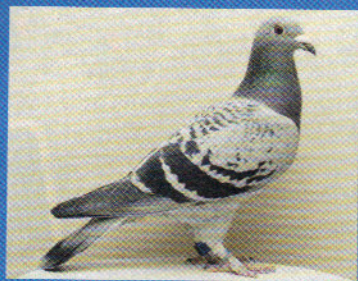
04-05-553: Superstar Dortmund